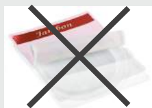
Emballage de charcuterie, viennoiserie...