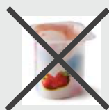
Pot de yaourt

Les pots et les barquettes en plastiques sont à mettre avec les ordures ménagères car ils sont aujourd'hui trop fins pour être recyclés.