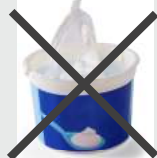
Pot de crème et de beurre