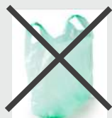
Emballage autour des bouteilles et sac en plastique

Les emballages recyclables sont à déposer en vrac sans sacs dans votre bac jaune.