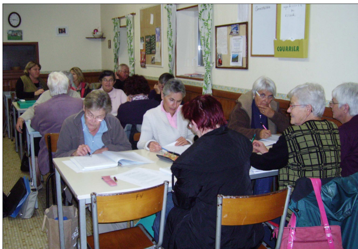
Des séances conviviales

Sans faute à Hanvec? Voilà l'objectif (ambitieux!) que s'est donné une vingtaine d'hanvécois. Le but de l'association est de faire se rencontrer des personnes de tous âges et de tous niveaux scolaires pour un approfondissement des connaissances or-