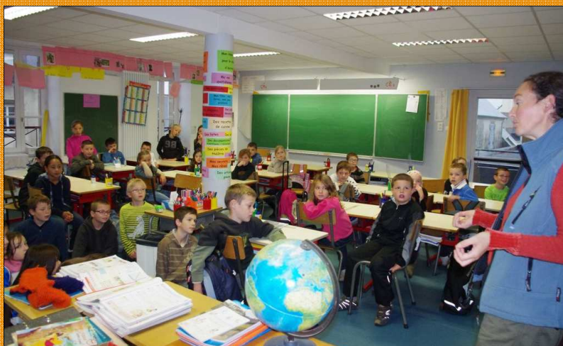
Les élèves ont été captivés par les récits de l'exploratrice.