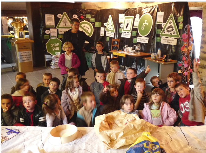
« Bienvenue à Poubellec'h ». Accueillis par une animatrice durant une heure, les classes des écoles hanvécoises ont appris à savoir quoi mettre dans un composteur, trier ses déchets, comprendre l'intérêt de boire l'eau du robinet... Une exposition ludique, interactive et enrichissante.