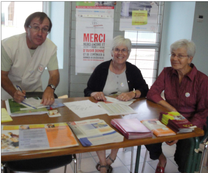
Le forum Dimerc'her a attiré beaucoup de monde le 11 septembre dernier. Ici l'amicale des donneurs de sang du canton de Daoulas.