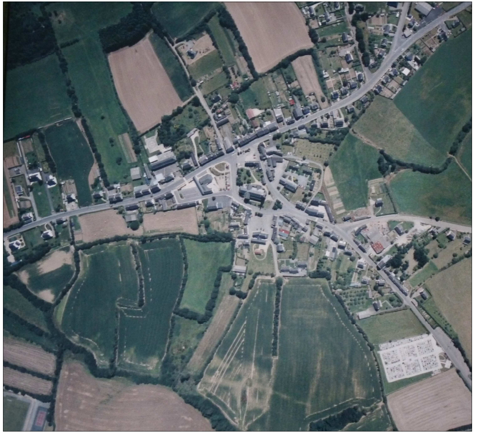
En France, le plan local d'urbanisme (PLU) est le principal document d'urbanisme et de planification de l'urbanisme.

Mais en trois décennies, ces villes se sont métamorphosées : elles se sont étalées, divisées entre lieux de vie, de travail, de commerce, de loisirs... favorisant l'usage de la voiture, engendrant des phénomènes de ségrégation mais aussi de coûts d'installation et de maintenance des réseaux insupportables. C'est ce constat et la volonté de promouvoir un développement urbain plus solide et plus durable qui a guidé l'élaboration de la loi "solidarité et renouvellement urbains" et la création du Plan Local d'Urbanisme.