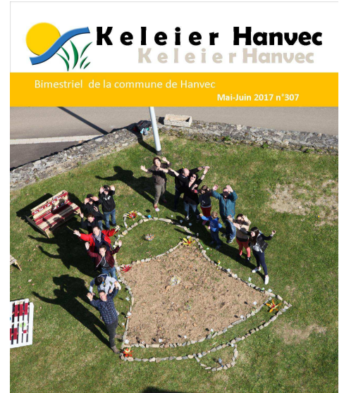
Dossier p.3 Les coins préférés des hanvécois