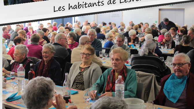
Le repas de la fédération des aînés ruraux

Le 11 mars dernier, la fédération des aînés ruraux du canton de Landerneau organisait un repas dans la salle Anne-Péron. Près de 200 personnes se sont ainsi retrouvées pour partager un kig ha farz concocté par le restaurant « La cuisine » situé à la gare de Hanvec.