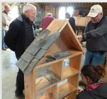
Atelier «auxiliaire de jardin»

Les élèves de GS/CP et CP/CE1 se sont rendus à Moulin-Mer pour une pêche à pied sur l'estran et étude des paysages de la rade de Brest. Magnifique journée au gros coefficient de marée et grand soleil. Les plus jeunes ont pris la direction de pont de Térénez. Ils réalisent à l'école, la maquette du pont qu'ils présenteront à Océanopolis dans le cadre du projet "jeunes reporters des Arts, des Sciences et de l'Environnement, l'occasion d'étudier le paysage, la faune et la flore. Ils ont eu la joie de croiser un groupe de jeunes dauphins communs. Une belle surprise dans le cadre magnifique des méandres de l'Aulne.